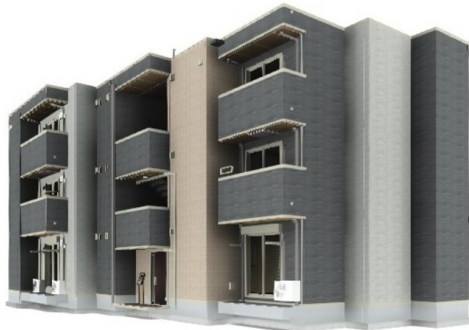
完成予想図につき実際とは異なる場合があります。