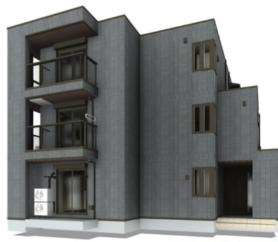
完成予想図につき実際とは多少異なる場合があります。